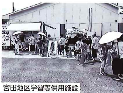
宮田地区学習等供用施設