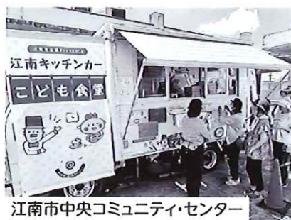
江南市中央コミュニティ・センター