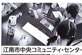
江南市中央コミュニティ・センター