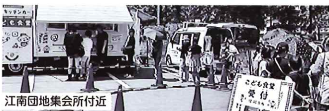
江南団地集会所付近