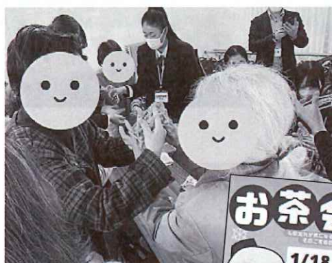
▲懐かしいと参加者同士で あやとりを取り合う姿も

当日は、お手玉を同時に3つ回す方や「次は合唱したいね」と話される方などそれぞれの企画で参加者のいきいきとした表情が見られました。