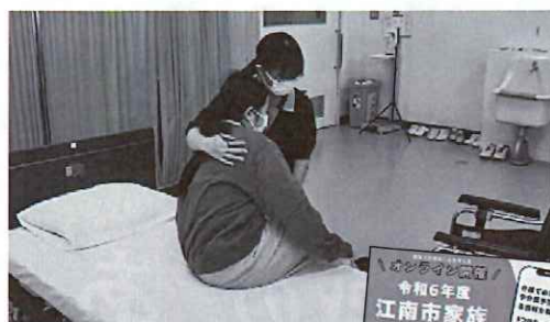
▲車いすからベッドへの 移乗介助を撮影

撮影した動画は、江南市社協公式YouTubeチャンネル「介護者も被介護者にも安全で楽な介助」にて、配信しています。是非ご視聴ください。