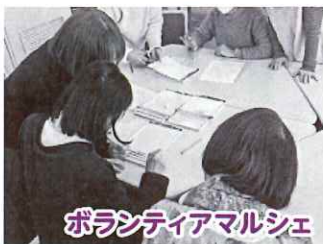
ボランティアマルシェ

江南市社協の登録ボランティアグループとともに、ボランティアを身近に感じてもらうきっかけづくりをしています。