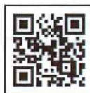
動画は こちらから▶